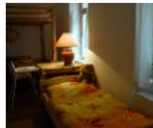
Jeden z pokojů pro hosty.

Každý den se společně snažíme dobře dívat a všem hostům našeho domu pozorně naslouchat – tak, abychom porozuměli jejich životnímu příběhu i jejich momentálním potřebám.