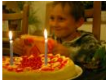
Zvládnutí náročné terapie a vypořádání se s vážnou nemocí bývá životním předělem, doslova znovuzrozením: mnohé děti tak po svém uzdravení slaví dvoje narozeniny...

Respitní dům vznikl důkladnou rekonstrukcí bývalé venkovské školy a poskytuje zázemí pro respitní péči. V případě potřeby také pomáhá vytvářet podmínky pro podporu rodin, doporučujících své nemocné dítě v konci jeho života.