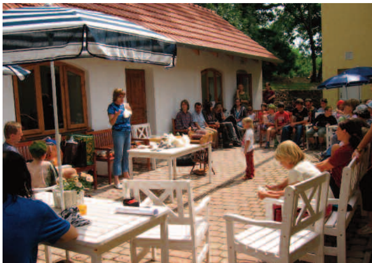
Dvorek před letní kuchyní v době letního tábora.

Současně s ukončením stavebních úprav jsme za domem získali nový venkovní společenský prostor, který jsme vybavili dřevěnými lavicemi a stoly se slunečníky. Za slunečného počasí má dvorek téměř středomořský ráz a je jak hosty, tak stálými obyvateli domu mimořádně oblíben.