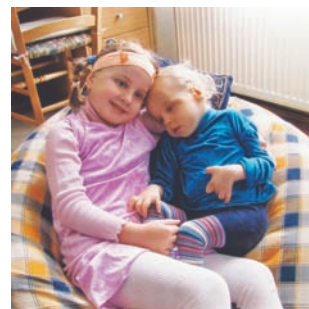
...a s Adélkou.

Chtěla jsem na příkladu Tomáškovy maminky jen ukázat, jak jsou rodiče schopní a šikovní zařídit si mnoho i velmi nesnadných věcí sami a po svém – a nepotřebují k tomu od nás okolo naší režii nebo dobré rady: stačí naše lidská a účastná přítomnost a povzbuzení, aby se osmělili vzít své záležitosti do vlastních rukou a všechno udělali podle svého.